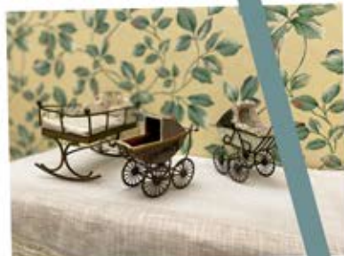
Détails des jouets de la chambre des sœurs Conchita et Lola.