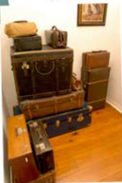
Détails de l'entrée.