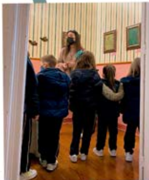
Visites scolaire au Musée.