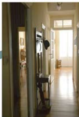
Hall et accès au musée.