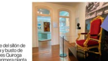
Detalle del sillón de Azaña y busto de Casares Quiroga en la primera planta.