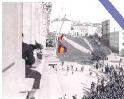
Ondeando la bandera republicana en el balcón del Ayuntamiento de A Coruña. Archivo del Reino de Galicia. Fotografía 3825.