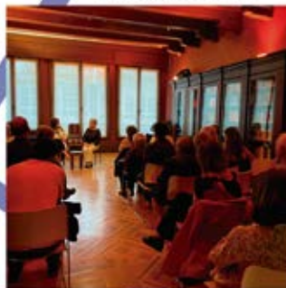
Actividades en la biblioteca de la segunda planta.