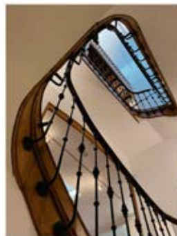
Escalera de acceso al museo.

La tercera planta está dedicada íntegramente a María Casares.