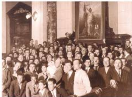
El pueblo y la República en el salón de plenos del Ayuntamiento coruñés.