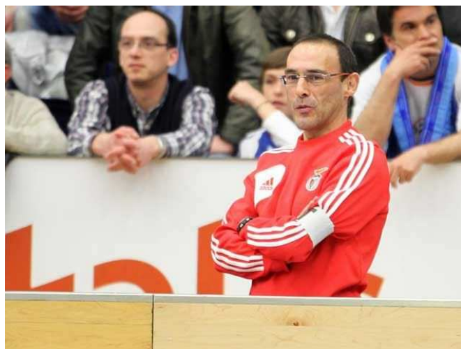
Luis Sénica Seleccionador Nacional Portugal